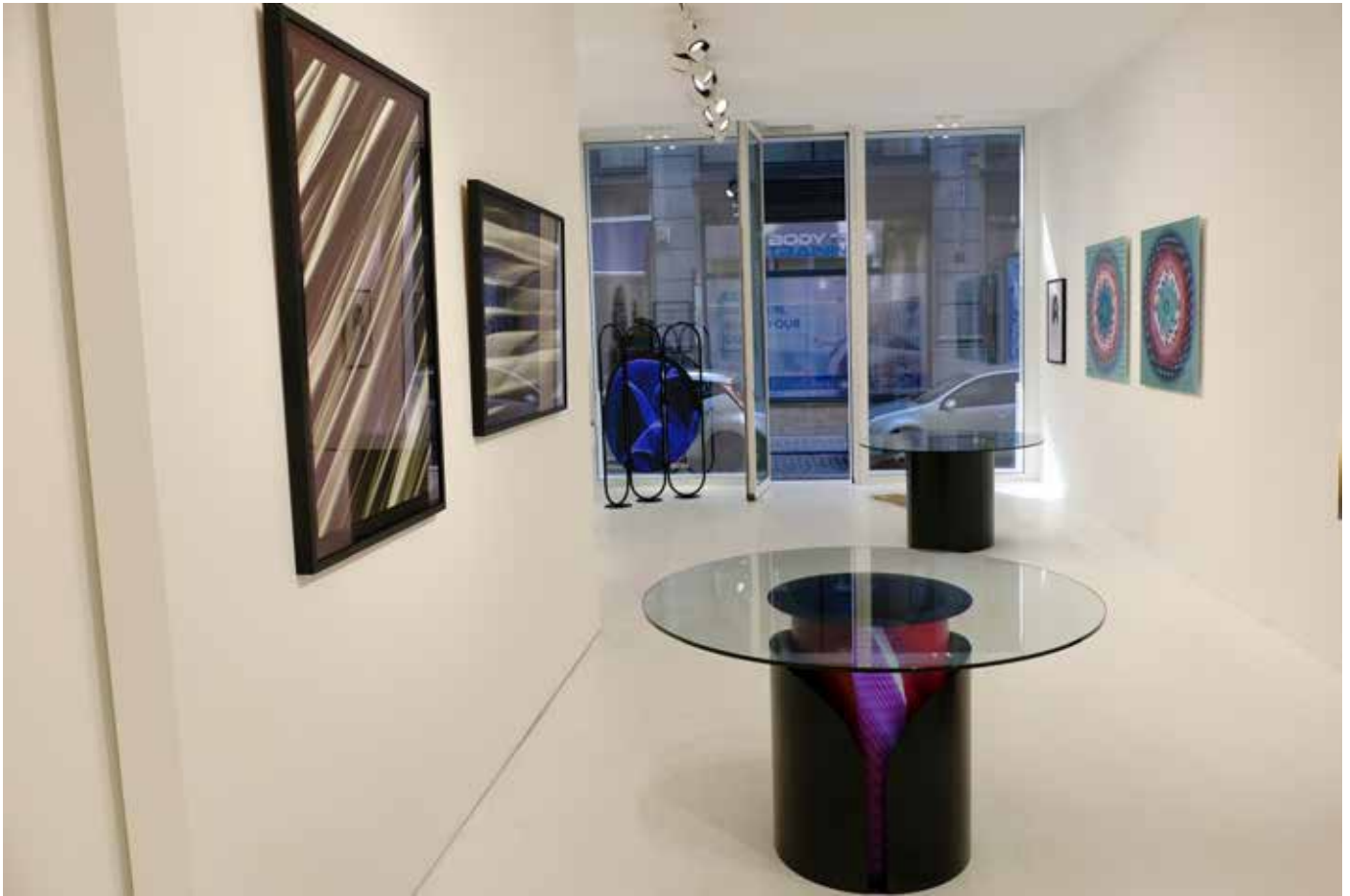
Vues de l'exposition