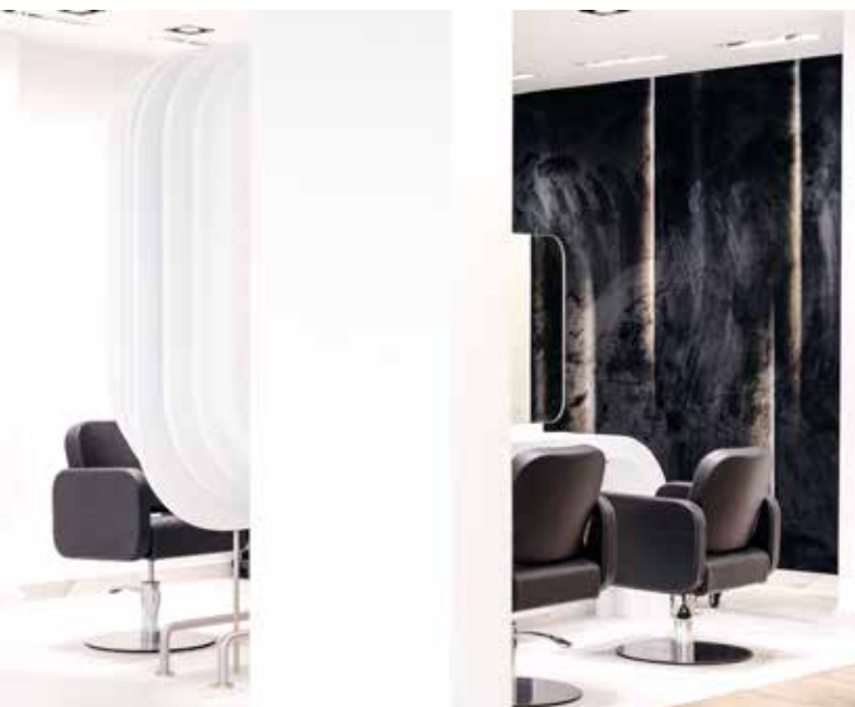
Le tapis dans le salon de coiffure «La Maison by JV»

D'autres évènements et créations suivront. Je ne manquerai pas de vous tenir au courant.