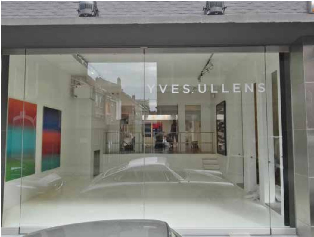
La Rasson Art Gallery à Tournai.