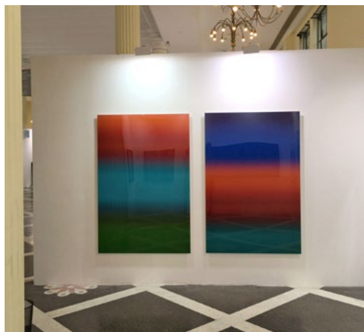
Photo Shanghai Shanghai Exhibition Center 1000 Yan'an Road (nabij Tongren Road) Shanghai - China http://www.photoshanghai.org/en/

Samuel Maenhoudt Gallery De Wielingen 3 8300 Knokke - België http://samuelmaenhoudt.com/