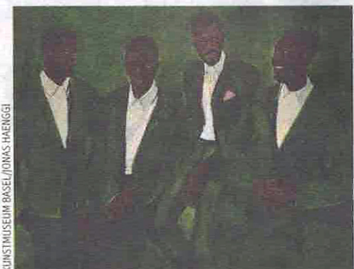
KUNSTMUSEUM BASEL/JONAS HAENGGI

Bâle vibre sous le pinceau de 120 artistes africains.