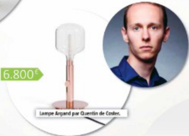
Lampe Argand par Quentin de Coster.