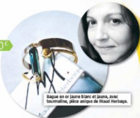
Bague en or jaune blanc et jaune, avec tourmaline, pièce unique de Maud Herbage.